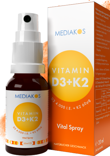
MEDIAKOS Vitamin D3 + K2 4.000 I.E. / 60 µg. Vital Spray Inhalt: 20 ml. PZN: 18096673