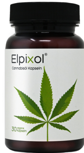
Elpixol Cannabis Kapseln Inhalt: 30 Stk. PZN: 18319133