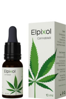
Elpixol Cannabisöl Tropfen 10 ml PZN: 16612550 UVP: 19,99 €