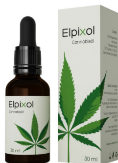
Elpixol Cannabisöl Tropfen 30 ml PZN: 16612544 UVP: 39,99 €