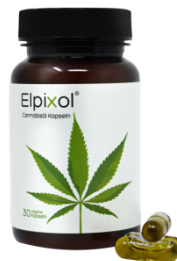
Elpixol Cannabisöl Kapseln 30 St. PZN: 18319133 UVP: 17,95 €