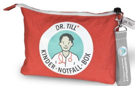
Klassiker 2022 limitierte Auf- lage)