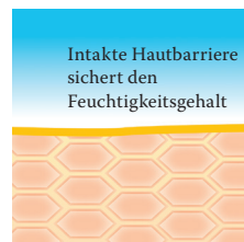
Intakte, schützende Hautbarriere mit Linolsäure-reichen Lipiden.

Dr. August Wolff GmbH & Co. KG Arzneimittel 33532 Bielefeld, GERMANY