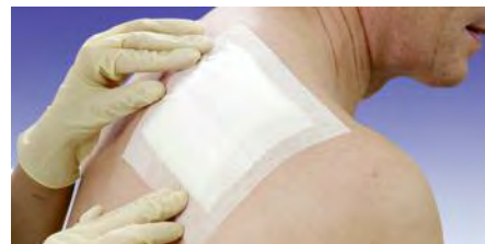
Omnifix elastic ermöglicht eine schnelle und sichere Vollflächenfixierung von Wundauflagen auch an schwierig zu verbindenden Körperstellen.

Zur vollflächigen Verbandabdeckung und Verbandfixierung in allen medizinischen Bereichen; ideal für Verbandfixierungen an Gelenken, runden und konischen Körperteilen; zur Befestigung von Messinstrumenten, Sonden, Kathetern usw.; bei Patienten mit empfindlicher Haut.