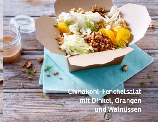
Chinakohl-Fenchelsalat mit Dinkel, Orangen und Walnüssen