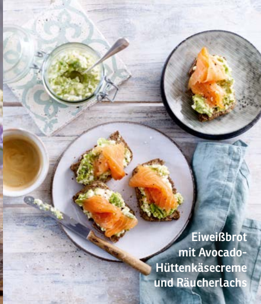
Eiweißbrot mit Avocado-Hüttenkäsecreme und Räucherlachs

1 Portion | 224 kcal | BE: 0,4 E: 18,4 g | F: 13 g | KH: 5 g