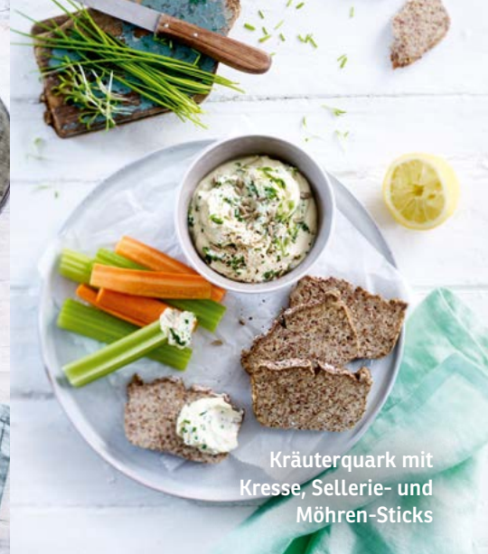
Kräuterquark mit Kresse, Sellerie- und Möhren-Sticks

Zubereitung: Den Quark mit Almased, der Milch und dem Öl glatt rühren. Nach Bedarf ein wenig kaltes Wasser ergänzen. Mit Salz, Pfeffer und Zitronensaft würzen, den Schnittlauch, Basilikum und geschnittene Kresse untermischen und abschmecken. Mit den Sonnenblumenkernen bestreuen. Den Sellerie und die Möhren waschen, putzen, bzw. schälen und beides