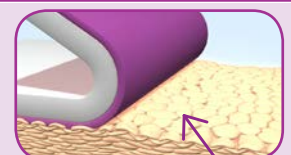
Kein Entfernen von Epidermiszellen mit der Safetac® Technologie