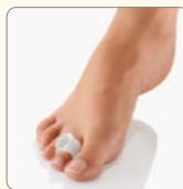
Zehenseparator mit Ring Art.-Nr. 107 650

Trennt verlagerte und eng anliegende Zehen und dient so als Korrekturhilfe. Er schützt vor Wundreibung, Hautreizungen und Hühneraugen zwischen den Zehen. Ein Ring der über den Zeh gezogen wird sorgt für einen sicheren Halt. Er ist physiologisch unbedenklich und verursacht keine Pilzgefahr in den Zehenzwischenräumen.