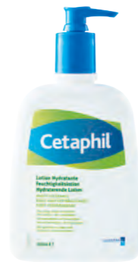
460 ml Spender

Ein System aus ausgewählten Feuchthaltefaktoren versorgt die Haut sanft und lang anhaltend mit Feuchtigkeit und schützt so vor Austrocknung.