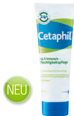
220 ml Tube