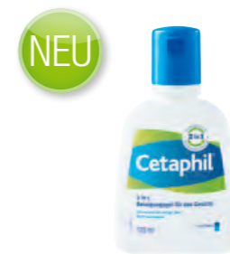
125 ml Flasche