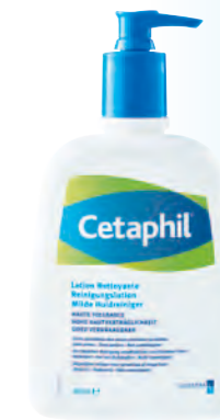
460 ml Spender

für empfindliche und trockene Haut am ganzen Körper