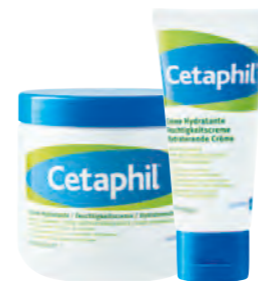
456 ml Tiegel | 85 ml Tube

für rissige, schuppige Haut mit angegriffener Barrierefunktion