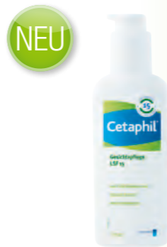
120 ml Spender

für alle Hauttypen - auch für empfindliche Haut