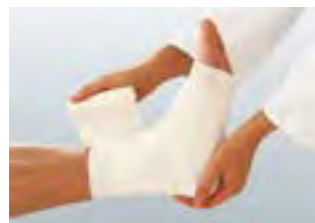
Uniflex® Universal/Uniflex® Color sitzen auch an viel bewegten Gelenken fest und sicher.