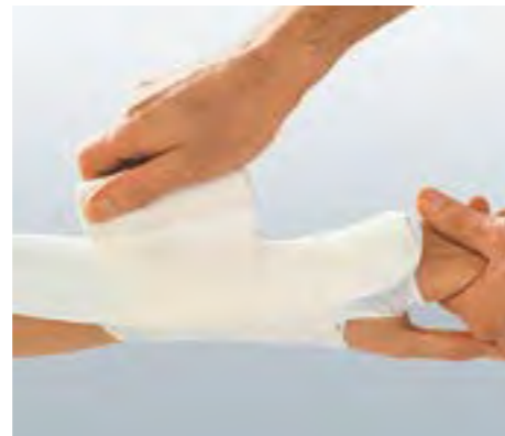
Für fixierende und unterstützende Verbände.