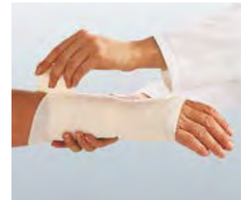
Für stützende und entlastende Verbände an viel bewegten Körperteilen.