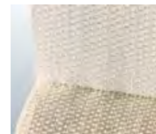
Ihre Kohäsivität verdankt Unihaft® dem mikroporösen Latexauftrag.

Unihaft® besteht aus 77 % Baumwolle, 22 % Polyamid und 1 % Elasthan.