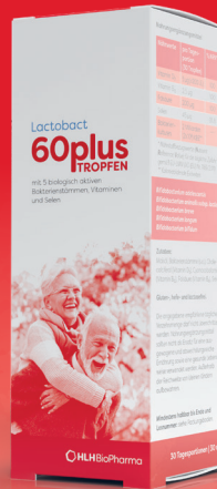
Lactobact 60plus TROPFEN