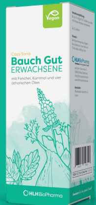
Casa Sana Bauch Gut ERWACHSENE