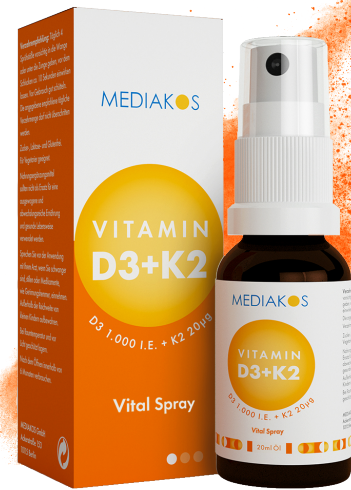
MEDIAKOS Vitamin D3 + K2 1.000 I.E. / 20 µg. Vital Spray Inhalt: 20 ml. PZN: 18133279