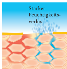
Lipidverlust führt zu einer gestörten Hautbarriere: Die Haut verliert viel Wasser und trocknet aus.

Haut entgegenzuwirken und sie vor weiteren Schäden zu schützen, ist daher sowohl eine regelmäßige Pflege als auch eine schonende Reinigung unerlässlich.