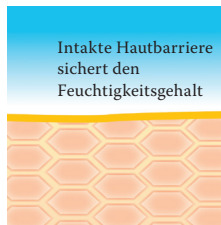
Intakte, schützende Hautbarriere mit Linolsäure-reichen Lipiden.

Um diesen Barrierestörungen sowie Fett- und Feuchtigkeitsdefiziten trockener