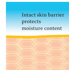
Intact protective skin barrier with lipids rich in linoleic acids.

That's why Linola offers a range of special products which have been developed to be used together and which are ideal